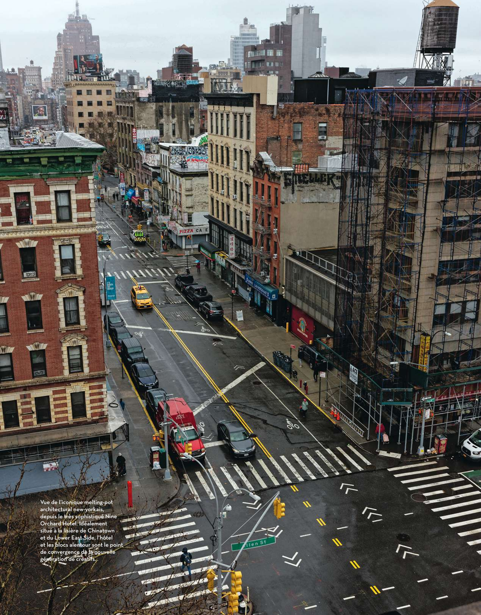
Vue de l'icône melting-pot architectural new-yorkais, depuis le très sophistiqué Nine Orchard Hotel. Idéalement situé à la lisière de Chinatown et du Lower East Side, l'hôtel et les blocs alentour sont le point de convergence de la nouvelle génération de créatifs.